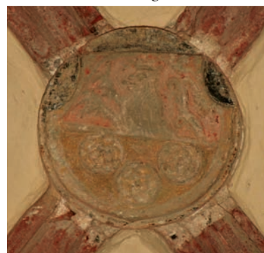
Švorník klenby se znakem olomouckého biskupa Stanislava Thurza.