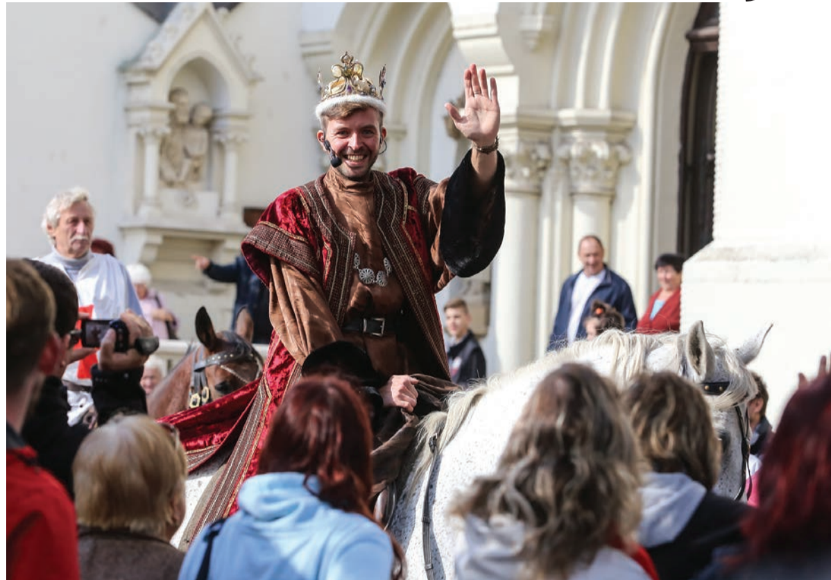
Svatý Václav přijíždí se svým průvodem, aby pozdravil všechny přítomné.

Svézt se na historickém kolotoči, nechat se vyfotit v historických kostýmech, navštívit tureckou střelnici, navíc jedinou v republice, využít služeb lazebníka nebo vstoupit do věštírny či mučírny, to vše můžete, pokud ve středu 28. září zavítáte mezi desátou a osmnáctou hodinou na náměstí Svatopluka Čecha v Přívoze. Právě tady se totiž uskuteční tradiční Svatováclavský jarmark, který je připomenutím svatého Václava,