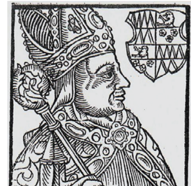
Biskup Thurzo v knize B. Paprockého Zrcadlo slavného markrabství moravského, 1573.